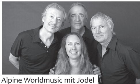
Alpine Worldmusic mit Jodel

Ein unschlagbares Quartett vereint drei Kulturen – musikalisch, menschlich und geografisch. Eine Wild-Jodlerin trifft auf Klavier-Virtuosität, kraftvolle Basslinien und mitreissende Percussion. «Sooon» verbindet Neue Schweizer Volksmusik, Global Yodeling, schamanische Gesänge, arabisches Musik, Klezmer, Folk und Jazz.